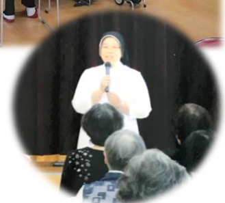
* 分かち合いの様子(図上)と、